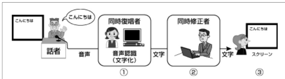
図1 音声同時字幕システムの運用の流れ

第1節でも述べたように、日本語使用環境における「音声同時字幕システム」を用いた情報保障が非常に高い精度であることから、我々の研究チームは、